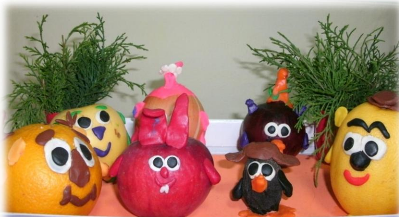
Дары осени от смешариков